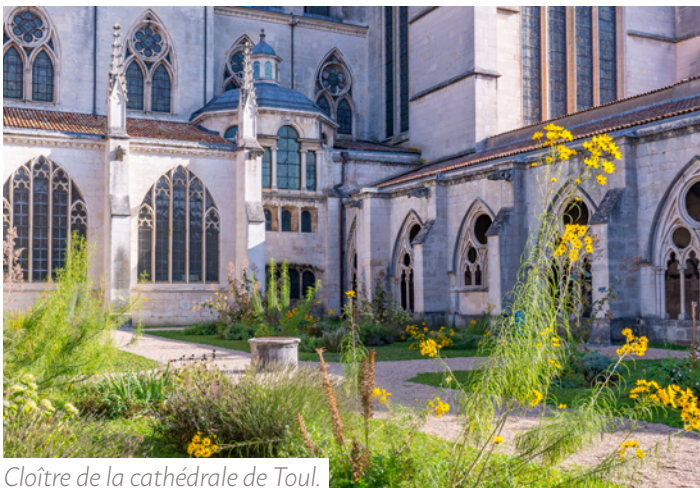
Cloître de la cathédrale de Toul.