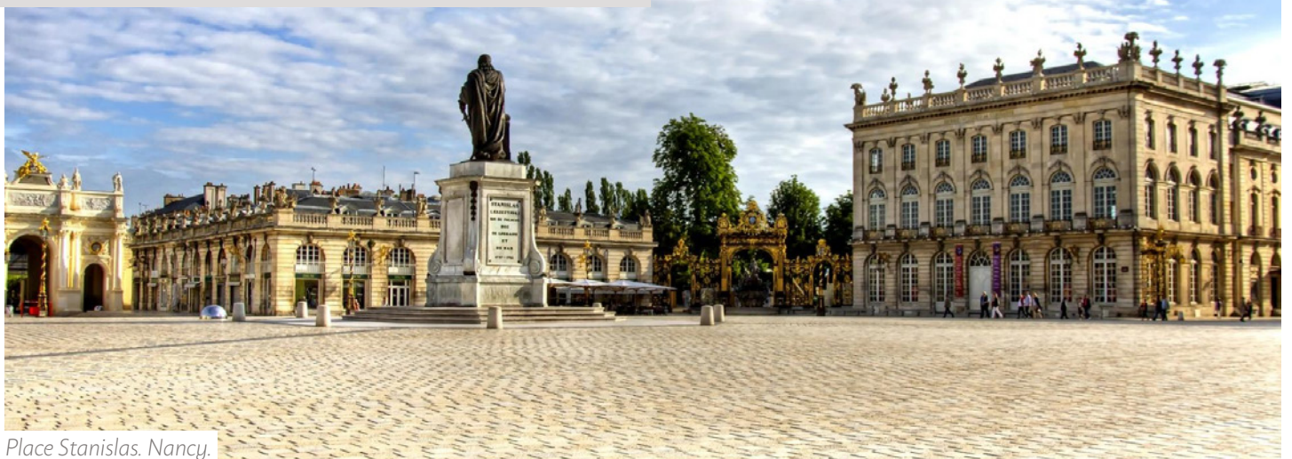
Place Stanislas. Nancy.