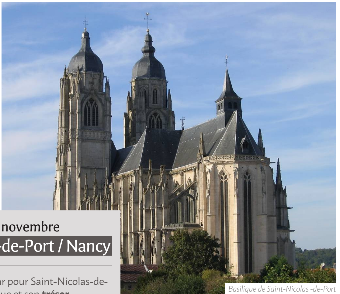
Basilique de Saint-Nicolas -de-Port