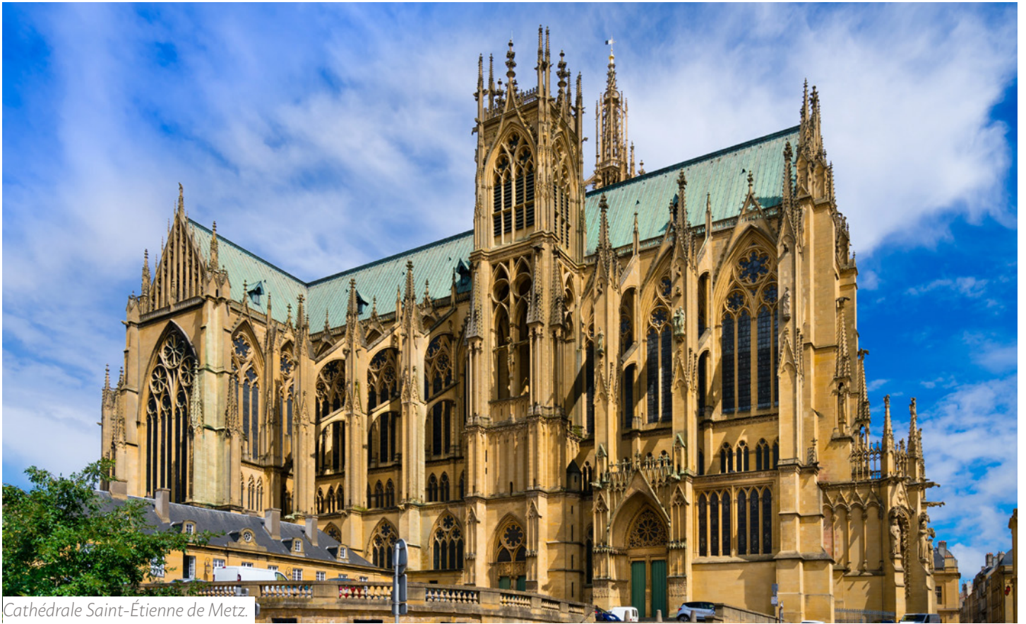
Cathédrale Saint-Étienne de Metz.