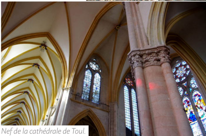
Nef de la cathédrale de Toul.