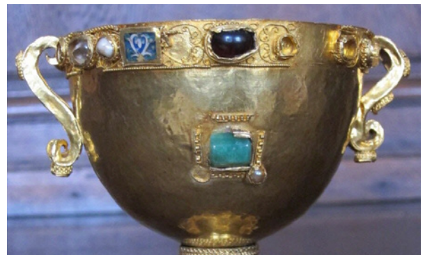
Trésor de Saint Gauzelin. Calice du X ème siècle. Cathédrale de Nancy.

20h — Dîner du congrès – Grande Brasserie du Commerce à Toul.