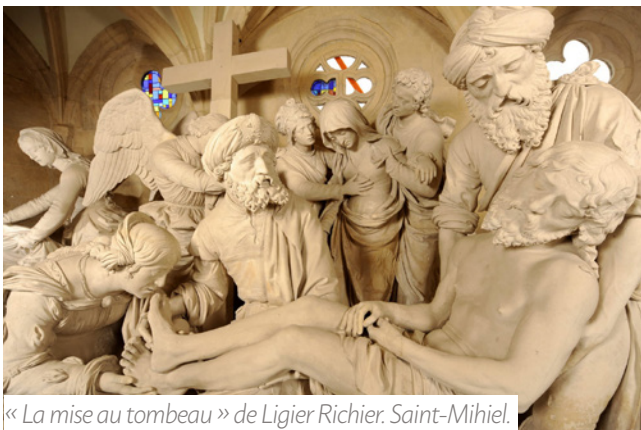
« La mise au tombeau » de Ligier Richier. Saint-Mihiel.