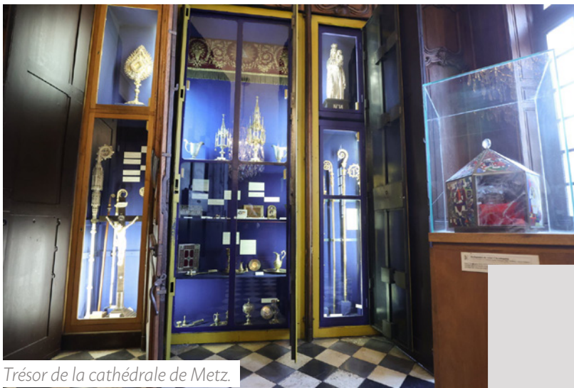
Trésor de la cathédrale de Metz.