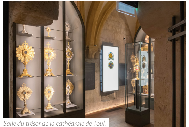
Salle du trésor de la cathédrale de Toul.