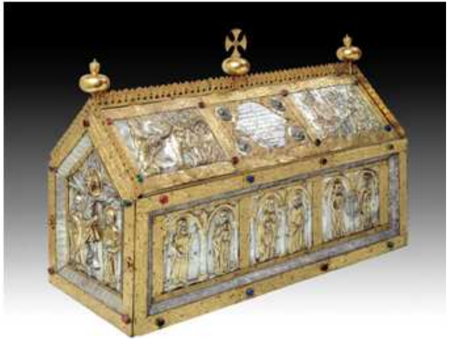
Châsse de Lierneux

La châsse peut être exposée sur le jubé, c'est-à-dire la clôture entre le chœur et la nef d'une église, mais aussi, comme à la Sainte-Chapelle à Paris, modèle par excellence, sur une tribune associée au maître-autel, ou encore intégrée à son retable, comme à Stavelot ou à Maastricht.