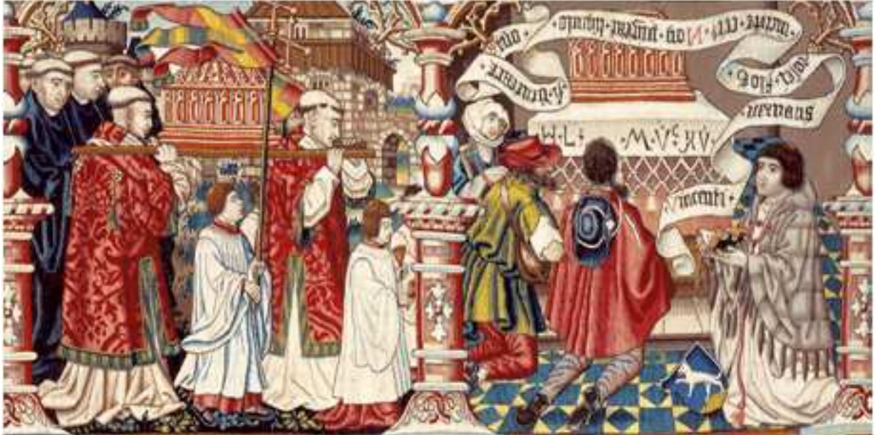
Tapissérie de saint Vincent (Bruxelles, 1515), Berne, Musée historique ©

L es reliques des saints, ces restes sacrés, souvenirs multiples et multiformes de personnages admirables et vénérés –des ossements, à tout ce qu'ils ont touché– peuplent le Moyen Âge : la « reliquiophilie » ou « reliquiolâtrie » fait partie des composantes de cette période charnière de l'histoire. Bien longtemps après, jusqu'à nos jours, les reliques occupent une place importante, en particulier dans la dévotion populaire.