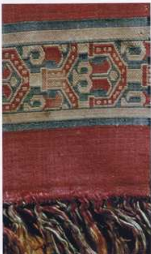
Premier suaire de saint Lambert (détail)

Surmontée d'un crêtage, cette riche armoire avait un socle peint en rouge, ses chanfreins et contours en or mat, et une ornementation de trente-deux statuettes en or, les visages et les mains en carnation, dans des niches au fond azuré scintillant d'or. Le Liber officiorum Ecclesiae Leodiensis , commencé en 1185 et complété en 1323, précise que le service de la fierte de saint Lambert, dû par sept bourgeois appelés les « sept fiévés », consistait à garder la châsse du saint lorsqu'on la transportait ou lorsqu'on l'exposait. L'institution des fiévés figure dans les Paix ou contrats intervenus entre le prince et les divers pouvoirs de la nation et les exemptions dont ils profitent.