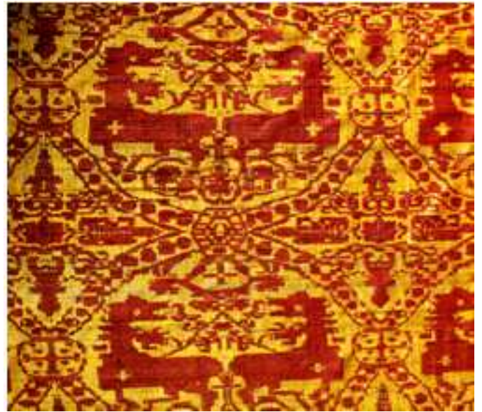
Second suaire de saint Lambert (détail)

Les conclusions capitulaires apportent de nombreuses mentions : en 1477, un paiement est fait au peintre Henri « pour rougir et redorer la fierte de saint Lambert » ; en 1484, un paiement est fait au trésorier pour la réparation d'un vase à eau bénite cassé, une image dont on a enlevé l'or et l'argent et une croix de procession.