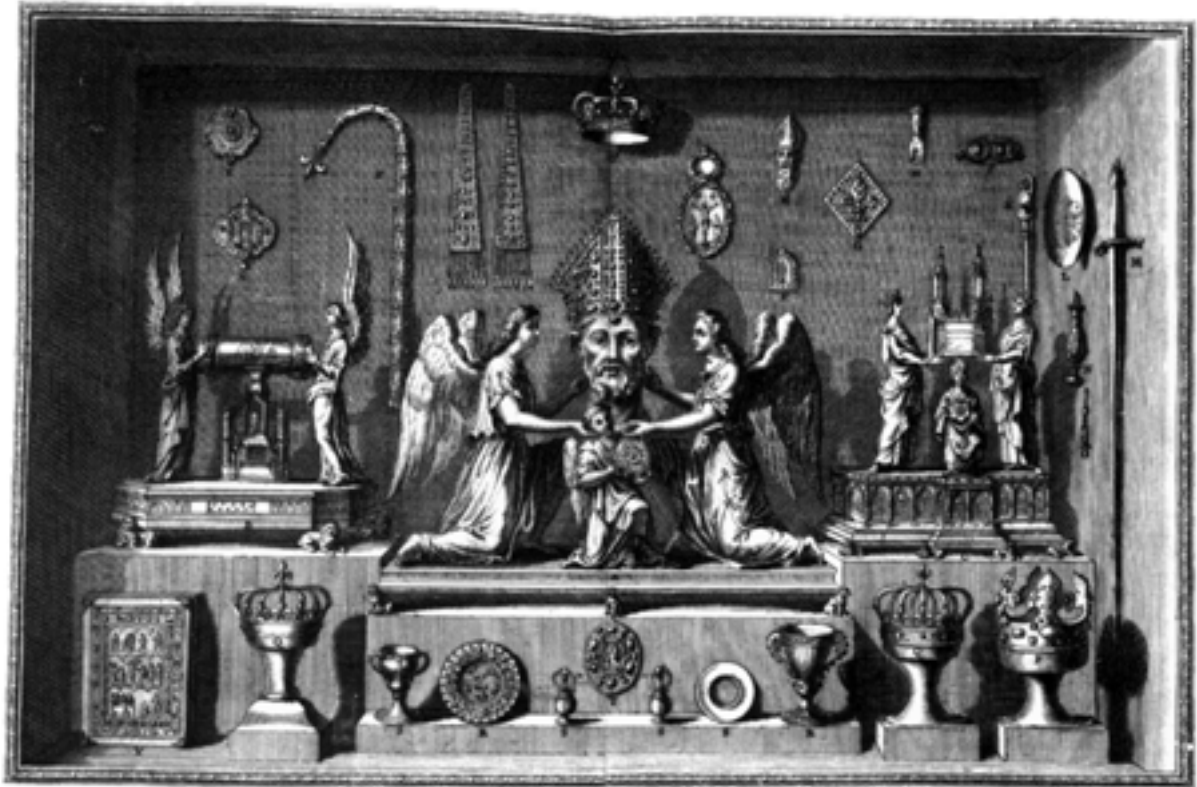
Trésor de Saint-Denis, Gravure de l'ouvrage de Dom Félibrien (1706)

Le trésor d'église devient la mémoire et la conscience historique et artistique d'une communauté, d'une ville ou d'une région. Il en conserve les reliques des saints comme principaux vestiges, mais aussi une multitude d'objets des plus variés, précieuse collection à la fois spirituelle mais aussi matérielle, annonciatrice du musée, conservatoire privilégié de l'art.