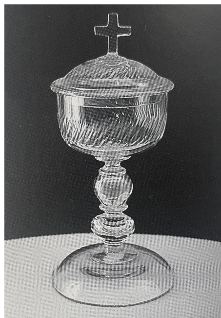
Fig. 8 – Ciboire, verre. Musée d'art sacré, Mours-Saint-Eusèbe.

qui ornent le ciboire de Mours-Saint-Eusèbe (fig. 8) ou la tige d'un calice conservé au Musée de la Haute-Auvergne (Saint-Flour). Un calice conservé à la cathédrale d'Autun, daté du milieu du XVIII e siècle présente un décor plus achevé et proche du décor civil (fig. 9).