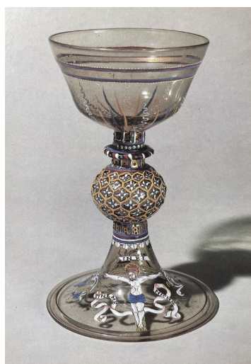
Fig. 6– Calice, verre peint et doré, France, milieu du XVI e siècle. Wallace Collection, Londres.

et restent une exception, c'est le cas du calice dit du jeudi saint, réalisé au XVI e siècle et conservé à la Sacristie pontificale (fig. 7).