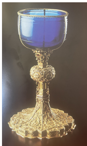
Fig. 5 – Calice formé d'un saphir taillé au V e siècle monté sur un pied en or au XV e siècle. Trésor, cathédrale de Monza.

à l'exemple de la coupe de saphir montée sur or conservée au trésor de la cathédrale de Monza 6 (fig. 5). A partir du XV e siècle, de grandes verreries réalisent des vases entièrement en verre souvent ornés d'émaux ou de peinture (fig. 6). Ces pièces somptueuses sont réservées à des personnalités ecclésiastiques ou à des sanctuaires insignes