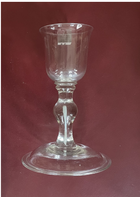
Calice, verre, moitié du XVIII e siècle. Coll. part.

De nombreux musées conservent des vases liturgiques en verre ou en cristal 1 . Quelques-uns sont des objets d'art du Moyen-Âge et de la Renaissance mais la plupart a été réalisée aux XVII e et XVIII e siècles ; il s'agit surtout de calices mais quelques patènes, ciboires et ostensoirs se rencontrent. La présente étude qui reste l'ébauche d'une recherche plus méthodique, s'est particulièrement intéressée à ce matériel qui interroge et prête le flanc à des explications fantaisistes 2 (fig. 1 et 2). Nous n'évoquerons pas la production artistique des XX e et XXI e siècles.