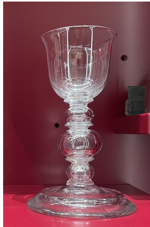
Calice, verre, 3 e quart du XVIII e siècle. Trésor, cathédrale Saint-Lazare, Autun.