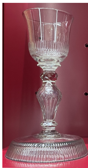
Fig. 9 – Calice, verre, 1 ère moitié du XVIII e siècle. Trésor, cathédrale Saint-Lazare, Autun.