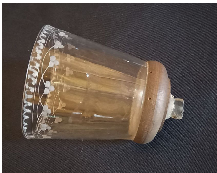
Fig. 10 – Coupe en cristal transformé en calice liturgique. Cathédrale Saint-Etienne, Auxerre. Fig. 11 – Pied en bois tourné soutenant la coupe. Cathédrale Saint-Etienne, Auxerre.