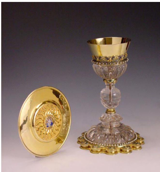
Fig. 7 – Calice, or, émaux, verre gravé. Sacristie pontificale.

et restent une exception, c'est le cas du calice dit du jeudi saint, réalisé au XVI e siècle et conservé à la Sacristie pontificale (fig. 7).