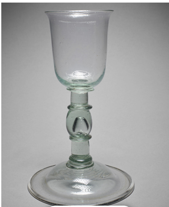
Fig. 15 – Verrerie de Tanville. Calice, Saint-Nicolas des bois, Musée d'art sacré de L'Orne.