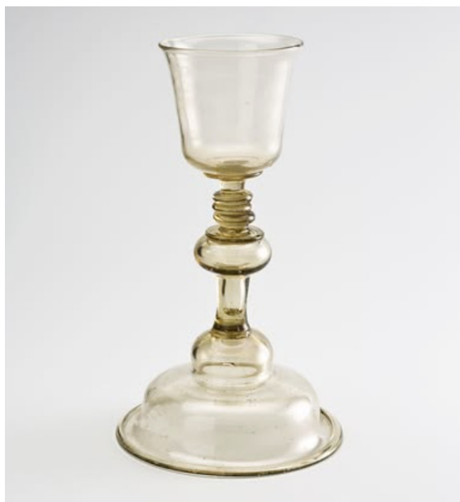
Fig. 14 – Verrerie de Valsaintes. Calice, Musée d'art et d'histoire, Fribourg (Suisse).

Plusieurs verreries fabriquant ce type d'objets sont connues 20 . Le calice de l'église de Maîche (Doubs) et deux ciboires, l'un à Gourmois et l'autre au Musée jurassien de Delémont proviennent de la verrerie de brief d'Etoz (Doubs). Les calice, patène et ciboire conservés au Musée d'art et d'histoire de Fribourg datés du milieu du XVIII e siècle (fig. 14), proviennent de la verrerie de Valsaintes (Alpes-de-Haute-Provence) tout comme celui conservé à Forcalquier. En Normandie, la verrerie de Tanville (Orne), spécialisée en flaconnerie et active de 1532 à 1886, a aussi réalisé des calices en verre comme ceux conservés au Musée d'art sacré de l'Orne (fig. 15 et 16). C'est aussi le cas de la verrerie de Sèvres, devenue la Manufacture des cristaux de la Reine, installée au Creusot en 1786.