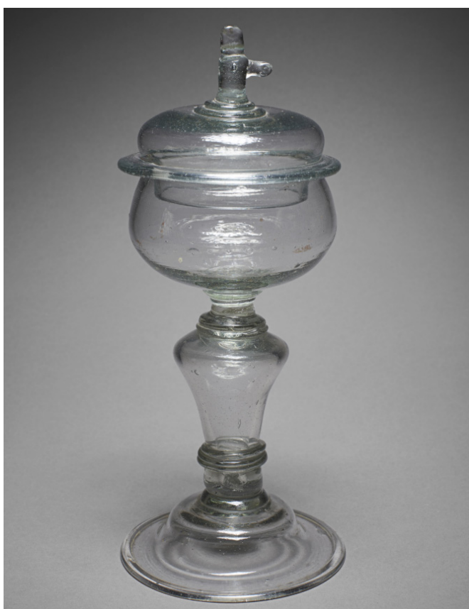
Fig. 16 – Verrerie de Tanville. Ciboire, Saint-Nicolas des bois, Musée d'art sacré de L'Orne.