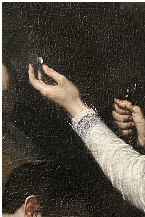
Fig. 3 & 4 – Légende de saint Donat d'Arezzo. Huile sur toile, Ribera, 1652. Musée des beaux-arts, Amiens Légende de saint Donat d'Arezzo, détail

Cependant, dans un désir de pauvreté, certains clercs privilégient les matériaux simples et non précieux. C'est ainsi que, d'après saint Jérôme, le saint évêque de Toulouse, Exupère (+ 415), ayant vendu les vases sacrés pour secourir les pauvres, « nihil illo diutius qui corpus Domini canistro vimineo et sanguinem portat in vitro. » 4 De même, la légende de saint Donat, évêque d'Arezzo, rapportée par Jacques de Voragine dans sa Légende dorée (1261-1266) fait état d'un calice de verre utilisé par le saint ; calice qui se brise mais dont le contenu, le vin eucharistique, ne se répand pas ! cet épisode est illustré par Jusepe de Ribera 5 (fig. 3 et 4).